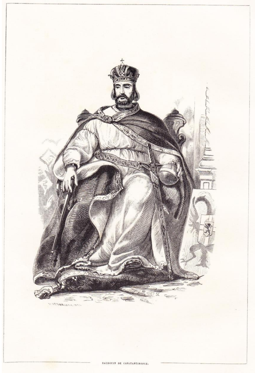
BAUDOUIN DE CONSTANTINOPLE.